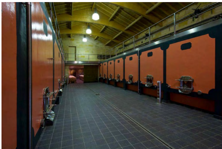
Les cuves de Château Larteau

Nez agréable, élégant. L'attaque en bouche est souple, veloutée, avec une belle finesse dans les tannins. Belle finale agréablement épicée. C'est un vin élégant, très agréable à boire, d'une belle finesse.