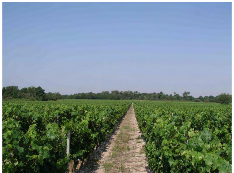
Vignes du Château Lacombe Noaillac