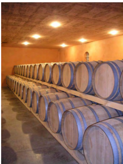
Les tonneaux du Château Lacombe Noaillac

La dominante Merlot de ce Médoc nous donne ici un superbe vin, à la fois souple, élégant et bien structuré.